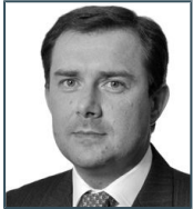
Gestor del fondo Leopold Arminjon